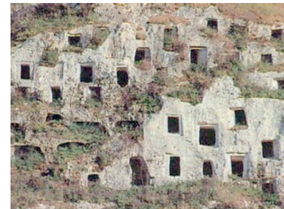
IL PARCO CHIAFURA È MERITEVOLE DI ATTENZIONE

"È ora che i pregevoli siti del SudEst siano meglio valorizzati: candidiamoli a Beni dell'Umanità". È il senso di una proposta di legge lanciata dal deputato nazionale Nino Minardo, che reca norme per favorire il recupero, la tutela e la riqualificazione, nonché il rilancio turistico e produttivo di siti di pregevole importanza naturalistica, artistica e architettonica del SudEst siciliano al fine di sostenere il loro inserimento nella lista dei beni Patrimonio dell'Umanità, Unesco. "L'obiettivo - spiega Minardo - è quello di promuovere lo sviluppo e rimuovere gli squilibri economici e sociali nei territori del sudest siciliano".